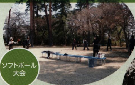
ソフトボール大会